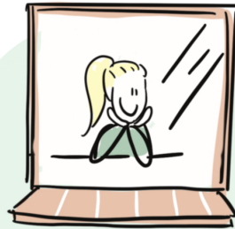
UIT HET RAAM KIJKEN