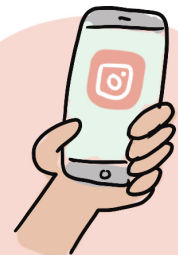
SOCIAL MEDIA CHECKEN